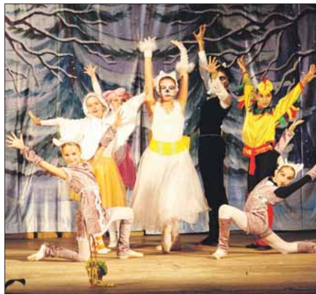
Сцена из нового спектакля «Кошкин дом»

В репертуаре коллектива — классические балетные номера, народные стилизации и современные постановки. Участники ансамбля и уверенно стоят на пуантах, и блестяще знают основы русского народного танца. Встречать