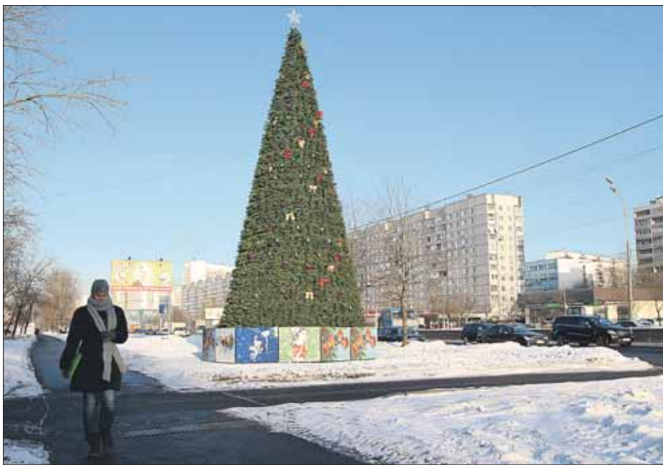
Новый год пришёл в Алтуфьевский район

Дополнительную информацию о порядке выполнения и приёмке работ вы можете получить в ГУП ДЕЗ района Алтуфьевский по адресу: ул. Стандартная, 3, каб. 12а, во вторник с 13.00 до 17.00, в четверг с 8.00 до 17.00, обед с 12.00 до 13.00, или по тел. (495) 707-0098.