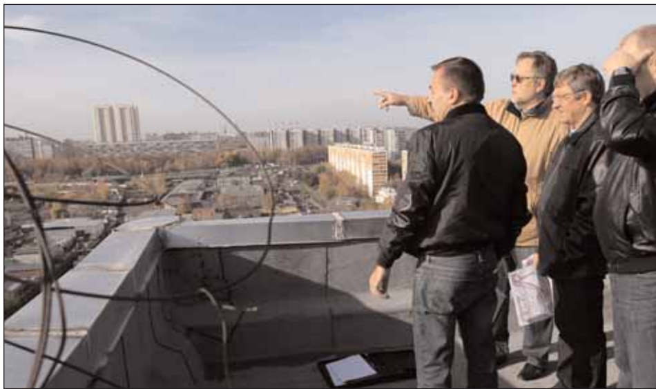
Префект рассматривает промзону с крыши дома

После осмотра участка префект встретился с руководством Бескудниковского комбината строительных материалов, который занимает большую часть пром-