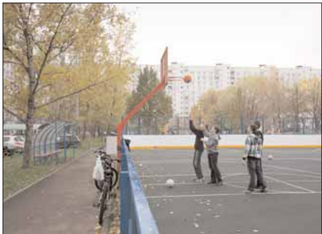
На площадке Бибиревская, 3 появились первые спортсмены

благоустройству, но и жилые дома, в которых предполагается провести выборочный капитальный ремонт. Кроме того, мы подготовили совместно с «Мосгорсветом» программу по дополнительному освещению района. Мы провели полную инвентаризацию всех территорий, где это необходимо. Одними из самых «больных» участков по-прежнему остаются территории возле поликлиники №43 на Черского и Костромской. По этим двум адресам — наибольшее число обращений жителей. К сожалению, установка световых опор по Костромской невозможна технически, поэтому мы дого-