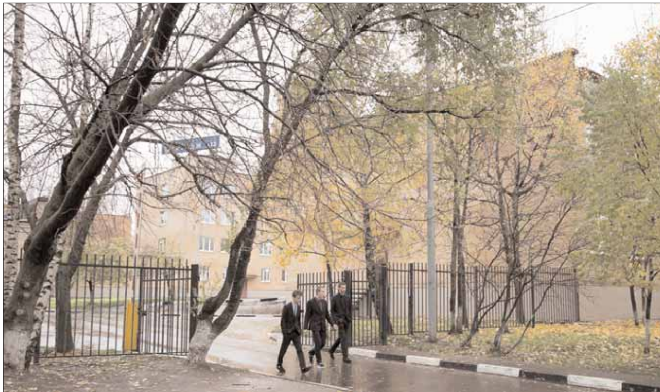
Сегодня в колледже обучается юнее 1200 человек

В фойе будет установлен бронзовый бюст Павла Овчинникова