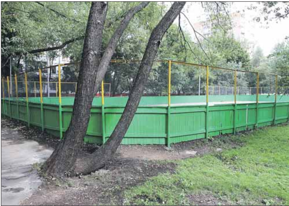
Вместо этой спортплощадки построят каток с искусственным покрытием

Проектом предусмотрено посещение катка маломобильными группами населения. Пропускная способность ледовой площадки во время спортивной тренировки рассчитана на 50 человек, а во время массового катания — на 80-120 человек. Так что тем, кто захочет просто прийти покататься, нужно будет купить билет.