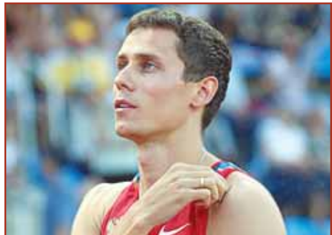
Юрий Борзаковский — олимпийский чемпион по бегу. Один из немногих легкоатлетов, способных поспорить на дорожке с кенийцами.