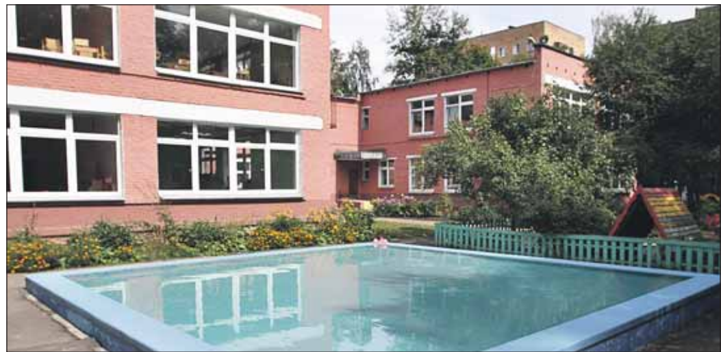
Отремонтированный детский садик станет начальным классом образовательного центра