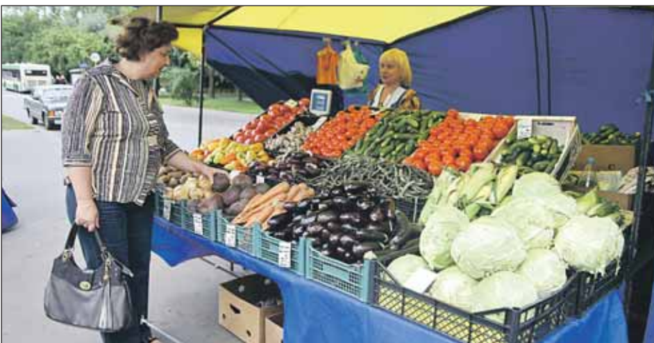
Ярмарка выходного дня у кинотеатра «Марс»