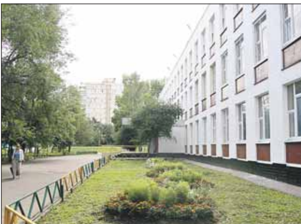
Двор школы №301 стал уютнее

В новом учебном году во всех школах нашего района появятся сразу несколько первых классов. В школах №1446, 1370 и 961 их будет три, в школах №301, 302 и 305 — два. Кроме того, в этом году две школы нашего района откроют свои двери для малышей. В школах №301 и 961 начнут работать группы детского сада.