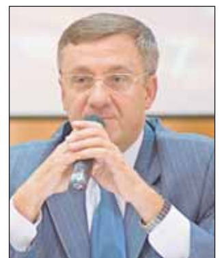
Валерий Виноградов рассказал, как будут решать транспортные проблемы

В программе кабельного телевидения «Час префекта» префект СВАО Валерий Виноградов сообщил телезрителям, что для решения транспортных проблем округа намечен целый ряд задач. Приоритет — улучшение движения общественного транспорта, развитие метро, создание новых линий автобусного транспорта и специальных полос для общественного транспорта. Такая полоса скоро появится на Ярославском шоссе, а в будущем — на Алтуфьевском и части Дмитровского шоссе.