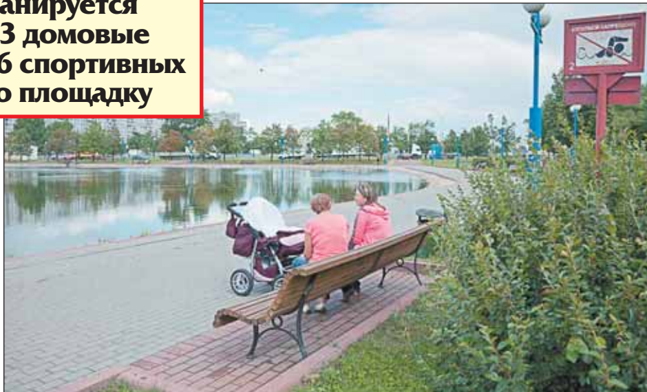
Купаться в пруду запрещено, но отдохнуть на берегу приятно

— Надо сдать все объекты к 1 августа, затягивать эти работы нельзя, — подчеркнул префект. — К подрядчикам, которые нарушают сроки и работают некачественно, надо применять санкции и ставить во-