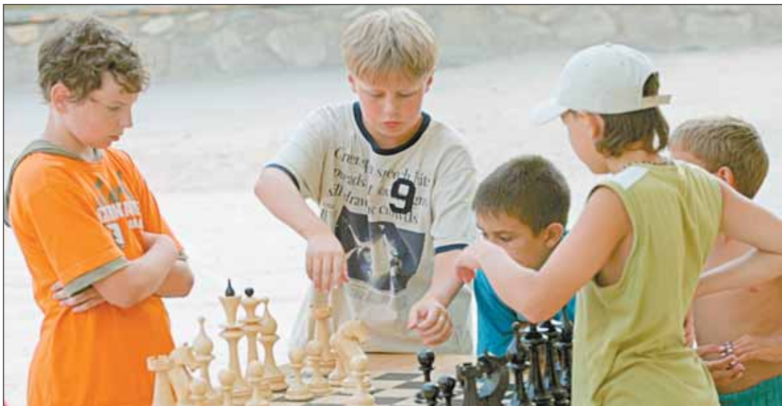
Съездив на одну смену, дети хотят вернуться сюда снова