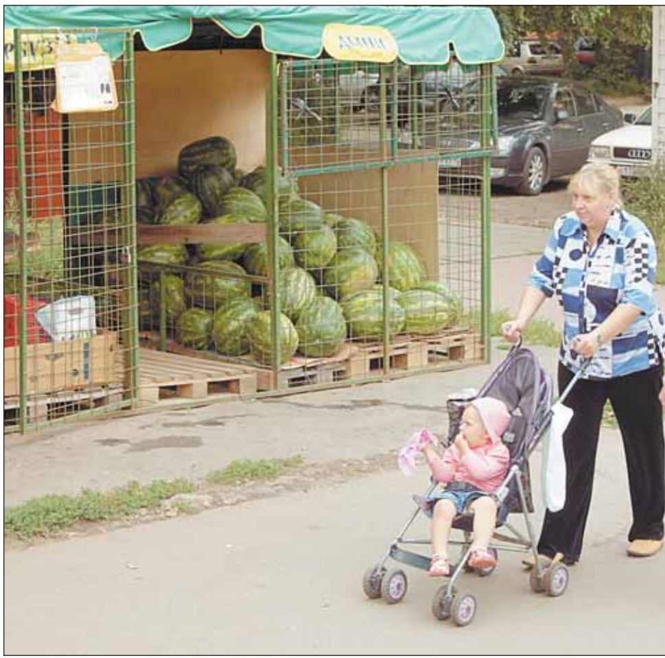
Арбузы и дыни можно купить на Путевом

Если за экологическую чистоту несут ответственность продавец и контролирующие органы, то спелость и вкус — вопрос везения покупателя. Вырезать кусочек на пробу продавец не имеет права, так что при выборе хорошего арбуза лучше воспользоваться традиционными советами.