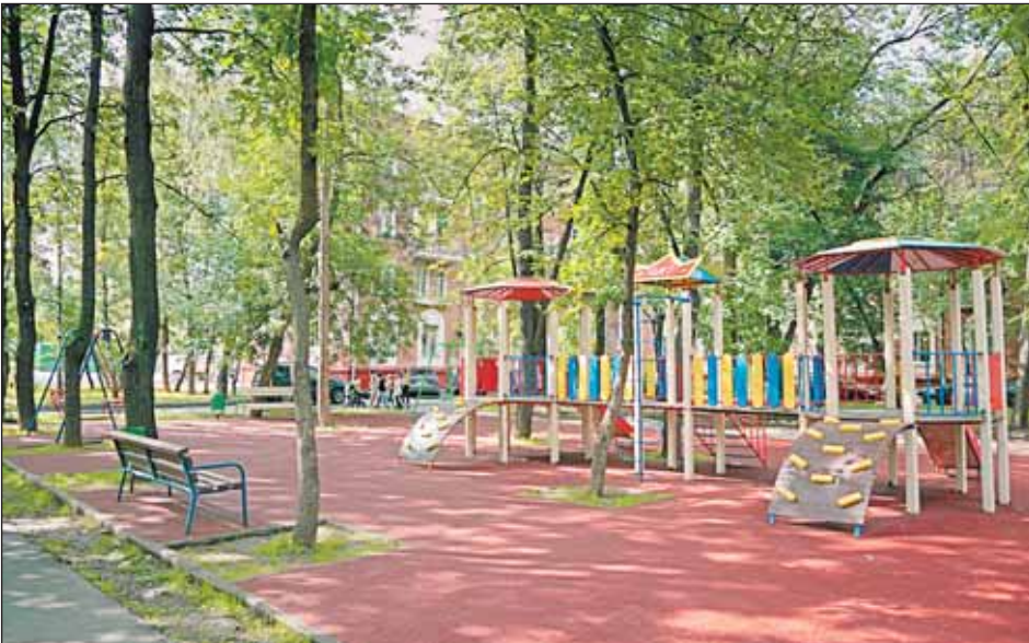
На площадке на Путевом, 50, можно играть и днём, и вечером