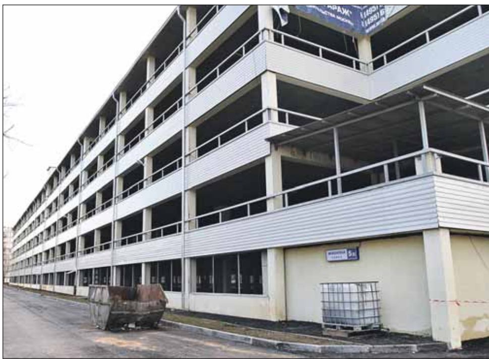
Осталось провести работы по благоустройству

— Гараж на Инженерной находится в шаговой дос-