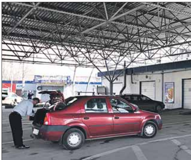
За повторный техосмотр не могут взять больше 720 рублей

Условия повторного осмотра для льготников в постановлении городского правительства отдельно не оговорены. На большинстве ПТО повторный осмотр стоит дешевле первичного, но на некоторых каждый раз берут полную стоимость. Владельцы коммерческих ПТО устанавливают эту ставку самостоятельно, власти регулируют лишь верхний предел. С 1 апреля он составляет 720 рублей.