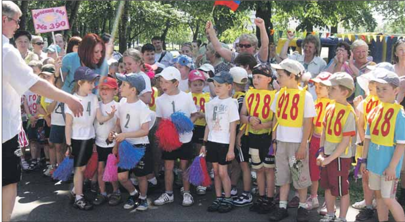
Малая олимпиада для дошкольников собрала более 200 человек

За истекший период по обращениям несовершеннолетних подготовлено 3 ходатайства о льготном поступлении и бюджетном финан-