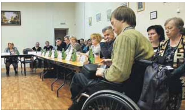
ЦСО «Алтуфьевский». Инвалиды смогли лично задать вопрос префекту