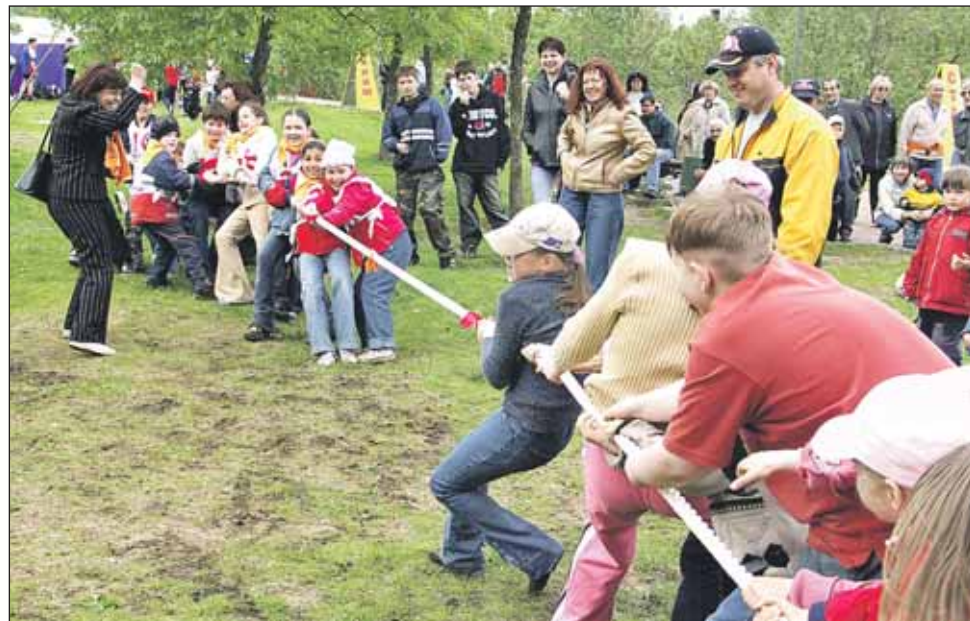
Кто сильнее — определяет дружба

20 мая в 10.00 в спортивном зале ЦО №1446 (ул. Костромская, 14в) — командное первенство по карате