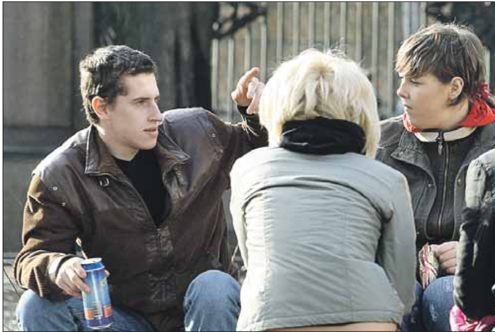
Молодёжь решает свои проблемы с помощью спиртных напитков