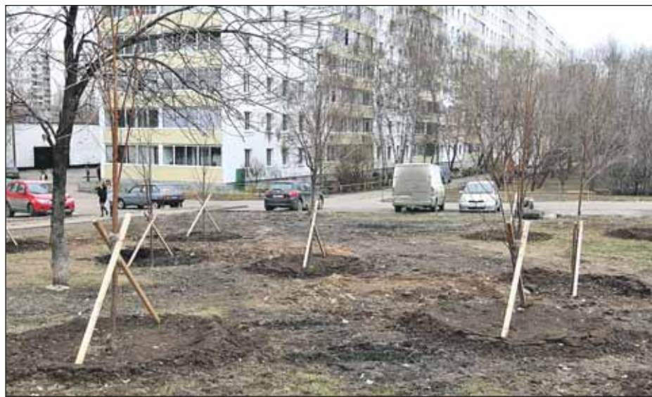
На Бибиревской из-под снега «вынырнули» молодые деревья, посаженные в декабре

Полный список дворов, подлежащих ремонту, будет опубликован в следующем выпуске газеты «Алтуфьево». Также эту информацию можно получить на сайте управы района: uprava-altufevo.ru