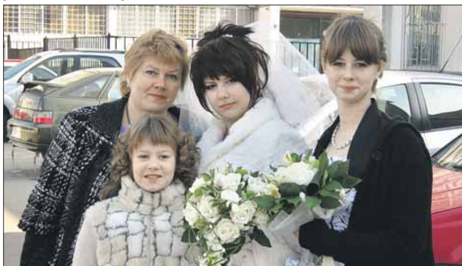
Мама и три красавицы-дочки

— Больше разговаривайте и доверяйте друг другу. И конечно, любите.