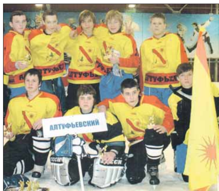
В следующем году наши хоккеисты намерены выйти в финал

— Потенциал у ребят, безусловно, есть, — говорит он. — Секция существует 6-й год, и последние 4 года мы стабильно входим в тройку сильнейших. Я уверен: на будущий год мы обязательно выйдем в финал. И не исключено, сможем победить. А по результатам этого турнира скажу: видно было, что технически наши были сильнее ярославских, активнее работали в нападении, броски были более точными, но у тех оказался очень сильный вратарь. Хотя игру наше-