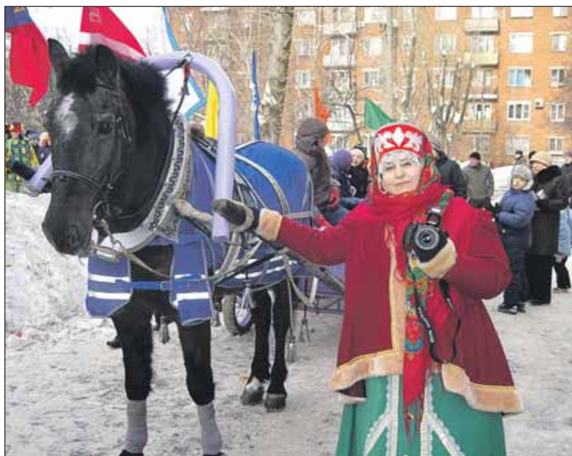
Все желающие в этот день могли покататься на лошадях

Большой театрализованный концерт «Русские богатыри» прошел 23 февраля на площади перед Домом культуры ОАО «БКСМ». Он был посвящен Дню защитника Отечества. Гости праздника смогли поучаствовать в веселых эстафетах и конкурсах для детей и родителей. Здесь же состоялась спортивная соревнования «Папа, мама, я — спортивная семья». Всех желающих в этот день катали на лошадях и угощали вкусными пирожками с горячим чаем.