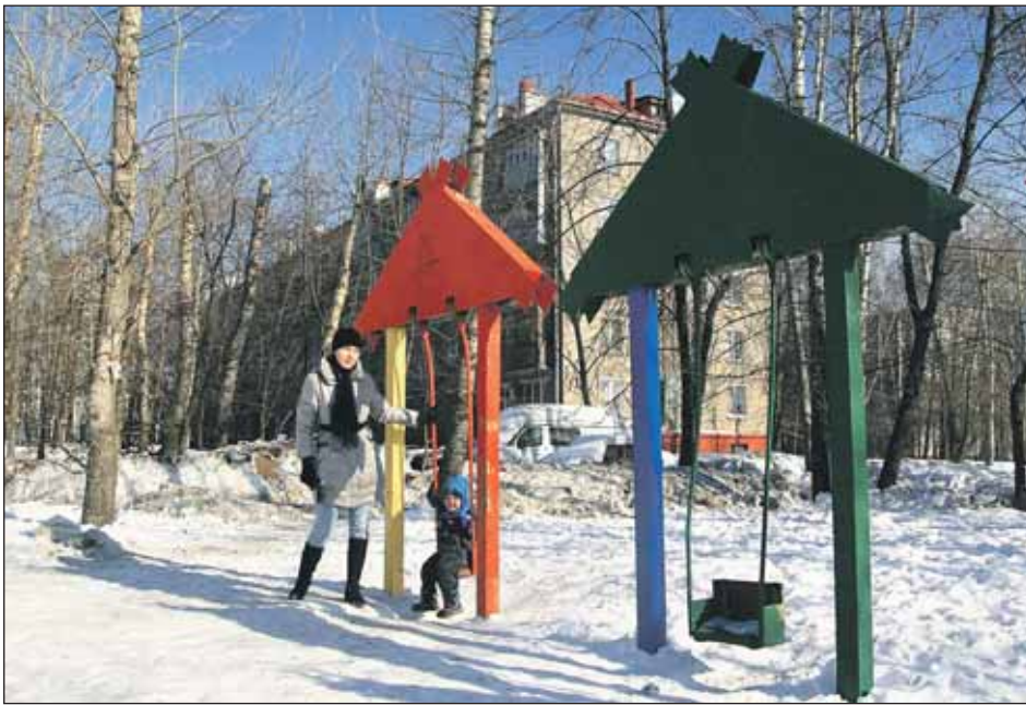
Путевой проезд, 10: здесь появится современный игровой комплекс для ребят

А еще в рамках программы благоустройства дворов в нашем районе будет построено 4 больших межквартальных детских городка с отличными современными игровыми комплексами — горками, лестницами, турниками, качелями. Они расположатся по Инженерной, 11, и Инженерной, 20, корп. 1, на Стандартной, 17, корп. 1, и Путевом проезде, 10. Го-