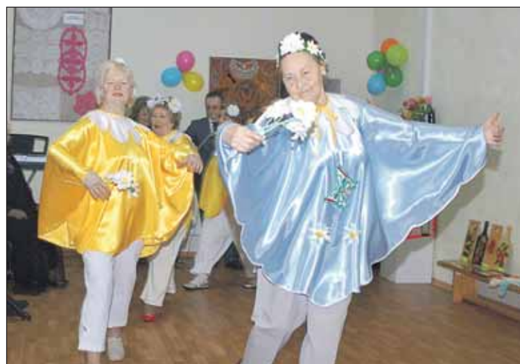
Дамы представили себя в свободной творческой форме