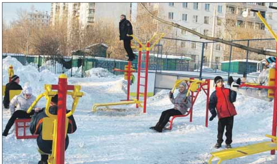
Спортплощадка с тренажерами на Костромской, 16-18, — любимое место ребятни