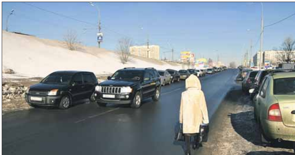
По дороге — дублеру Алтуфьевского шоссе трудно проехать из-за припаркованных машин

— Район у нас небольшой, крупных магистралей не так много, поэтому работы по расширению дорог не планируется. Мы сосредоточимся на обустройстве асфальтированных заездных карманов — в основном на Костромской, Инженерной, дороге —