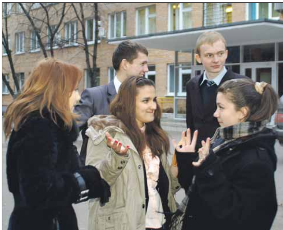
Бал для молодёжи пройдёт 23 декабря в колледже на Бибиревской, 6, корпус 1

28-30 декабря в 16.00 на ул. Костромской, 16-18, — новогодний турнир среди дворовых команд по хоккею, 1-й этап спартакиады.