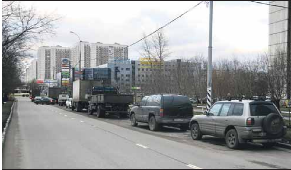
Особенно часто угоняют с дублёра Алтуфьевки, между домами 56-66

Большим числом угонов выделяется в районе и Бибиревская улица. Здесь пропало 10 автомобилей. Угоны на Бибиревской случаются на всём её протяжении, но больше всего — от домов 7 и 17 (по 3 ма-