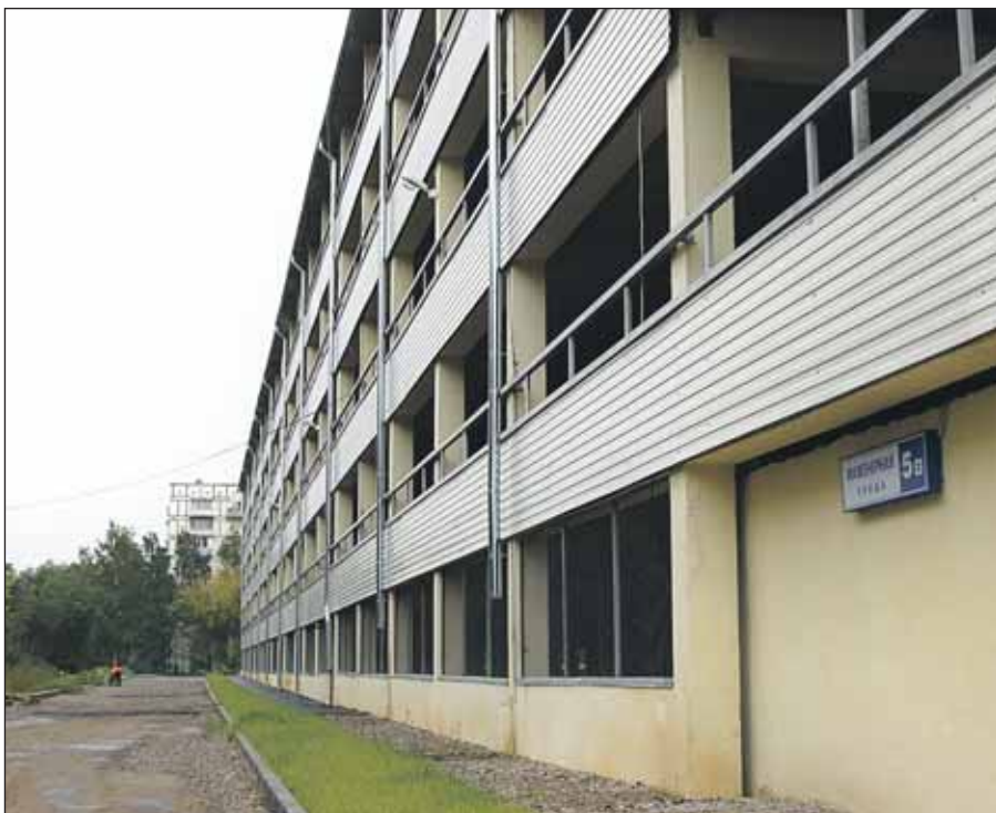
40 процентов мест в народном гараже на Инженерной, 5, уже раскуплены