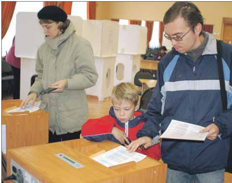
Информация о делах партий в СВАО — совсем не лишняя перед голосованием 4 декабря

Жителям округа было предложено ответить на вопросы о качестве работы поликлиники, о работе участкового врача, об организации записи и сроках ожидания приёма врачами-специалистами, об отношении врачей к пациентам, о тех-