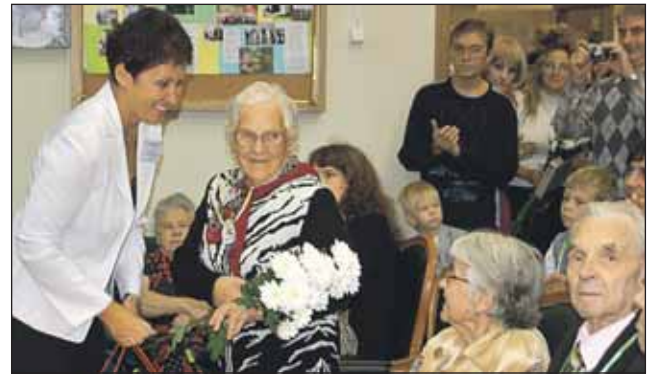
В праздник чествовали заслуженных людей района

В этот день в красивом здании ГУ КЦСО на Путевом пр., 20, корп. 2, царил радостная атмосфера. На праздник пришли ветераны с орденами и медалями на груди, пенсионеры в лучших своих нарядах, их дети, внуки и даже праправнуки. Присутствовали также начальник окружного Управления социальной защиты