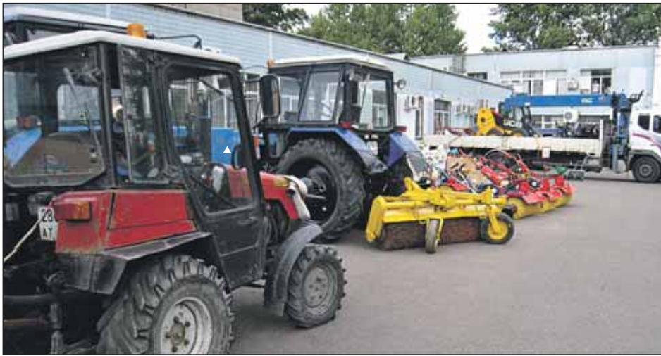
Все эти тракторы и мотоблоки зимой выйдут на улицы Алтуфьева