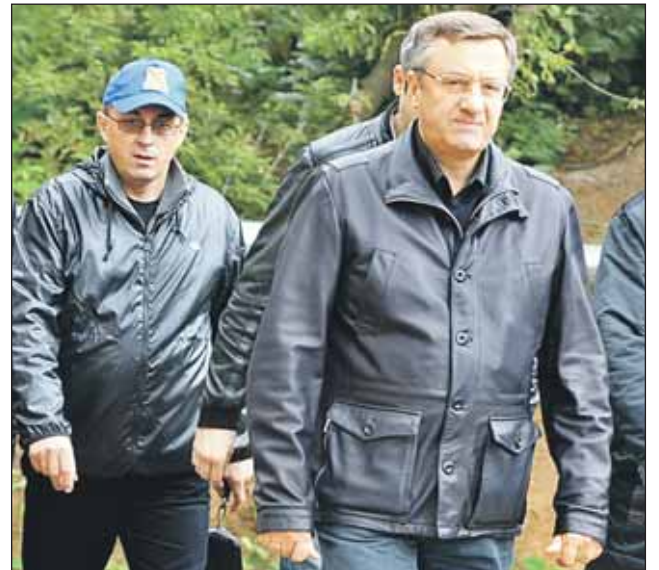
Префект Валерий Виноградов посетил строящиеся объекты нашего района