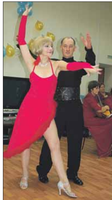
Бальные танцы в исполнении коллектива «Алемана» были встречены на ура

и Комплексный центр социального обслуживания населения «Алтуфьевский» находится по адресу: Путевый пр., 20, корп. 2. Телефон для справок (499) 902-9704