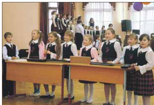
В День учителя в 302-й школе показали праздничный концерт

Не забываем мы и о наших педагогах и работниках дошкольного образования. Для них в преддверии Дня учителя, 4 октября, в школе №305 на Путевом проезде, 10, был устроен праздничный вечер. По традиции вначале состоялось награждение особо отличившихся педагогов памятными медалями «За заслуги перед Алтуфьевским районом». Кроме того, в День учителя в школах нашего района стараниями учеников пройдут праздничные концерты.